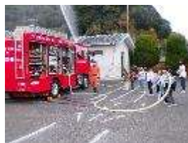
消防車からの放水

避難訓練 11月27日 今回は、火災を想定した避難訓練を行った後、消防署の方の指導のもと、消火訓練や消防車による放水の見学、煙道体験を行いました。万が一火事が起きてしまったときにどのように行動すればよいのか考える機会になりました。