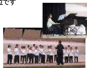
素晴らしい発表でした

八日市場ドームを会場に匝瑳市小中音楽発表会が開催されました。豊和小からは4年生以上の児童が参加し、リコーダー合奏「青と夏」と二部合唱「COSMOS」を演奏しました。前日の11日には校内で壮行会を行い、1・2・3年生の前で素晴らしい演奏を披露してくれました。本番では、大勢の観客の前で堂々ときれいなリコーダーの音色と美しく豊かな響きの歌声を会場中に響かせることができました。聴く人の心に残る素晴らしい演奏でした。