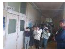
理科室での煙道体験の待機中

シニアクラブのみなさんとの交流 11月28日 3, 4年生の子どもたちが、豊和シニアクラブ連合会のみなさんとグラウンドゴルフによる交流を行いました。子どもたちは4つの班に分かれ、シニアクラブの方々に教えていただきながらコースを周りました。気持ちのよい青空の下、楽しい時間を過ごすことができました。ご協力ありがとうございました。