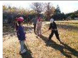
シニアクラブのみなさんと楽しく交流しました

いきいきばっ子「元気アップ・プラン大作戦」実施中 11月は「朝ご飯を食べよう」という目標に向けて取り組んできました。各家庭のご協力のおかげで、子どもたちは朝から元気に学校生活を送っています。12月は、学年ごとにゲームやスマホ、タブレット、テレビ等の機械を使い終える（見終える）時刻を決め取り組んでいます。元気に年を越せるよう、生活習慣を整えていきましょう。