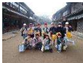
昔の町並みをバックに

3年校外学習 11月26日 栄町にある房総のむらに行きました。昔の民家の様子を見学したり、昔の遊びや絵付け、おせんべい焼きを体験したりと、学校ではなかなかできない経験をたくさんし、充実した学習になりました。