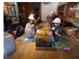
集中して色を付けています

避難訓練 11月27日 今回は、火災を想定した避難訓練を行った後、消防署の方の指導のもと、消火訓練や消防車による放水の見学、煙道体験を行いました。万が一火事が起きてしまったときにどのように行動すればよいのか考える機会になりました。