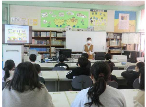
思春期講座の様子

産婦人科の助産師の方を講師にお招きして思春期講座を行いました。4年生以上のこれから大人へと成長していく子どもたちを対象に命の大切さについてお話をいただきました。「人の命は大昔からとぎれることなくずっとつながっていて、この世に生まれてきたことは奇跡で素晴らしいこと」、「一人一人の命はかけがえのないものであり、自分や周りの友だちも大切な存在であること」、「一人一人個人差がありお互いを認め合っていくことが大切であること」など、思春期の子どもたちが不安を感じることをわかりやすく丁寧に説明してくださいました。子どもたちは少し恥ずかしがりながらも真剣に先生の話聞き、命を大切にすることを育んでいました。