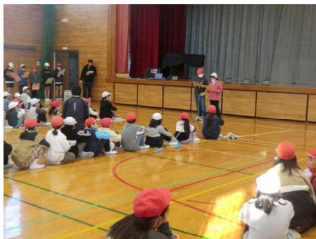
なわとび大会開会式