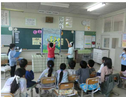
龍尾寺の伝説の劇

2年生が「まち探検」に行き、学習してきた内容を1年生に発表しようと、1年生を教室に招き「とよわのすてきはっぴょうかい」を行いました。まち探検で見学させていただいた、ふれあいパークさん、駐在所さん、床屋さんについてはクイズ形式で写真や文字