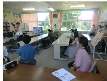
第1回家庭教育学級「救命講座」

7月12日(水)、匝瑳市生涯学習課の先生方を迎え、豊和小家庭教育学級の開級式が行われました。1回目の今日は、本校の養護教諭による「家でもできる救急法」と題して、救命講座を実施しました。子どもの事故の現状や救急車の呼び方、AEDの使い方についてなど、実際に起きてしまった時に慌てないための具体的な方法について確認する機会となりました。これから9月の親子バス遠足をはじめ、収穫体験、給食試食会など、子どもたちの成長につながるような、親同士の親睦がさらに深まるような行事が計画されています。