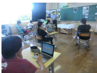
6年生の道徳の授業

GIGA構想がすすめられ、一人一台のタブレットが全校児童に配られてから今年で2年目になります。高学年は今では授業中にタブレットはあって当たり前といった風で、ほぼ毎日といっていいほど様々な教科で活用しています。低学年の子どもたちも学級担任を中心に、校内の情報担当や市のICT支援員から操作の仕方を教えていただきながらどんどん使い方を覚え、授業で活かせるようになってきています。