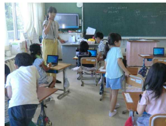
1年生も頑張っています